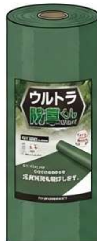
最強：ウルトラ防草くん 300G (300g/m 2 ) 法面・曝露向け