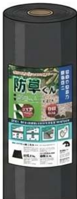
標準：防草くん (80g/m 2 ) 庭・DIY向け