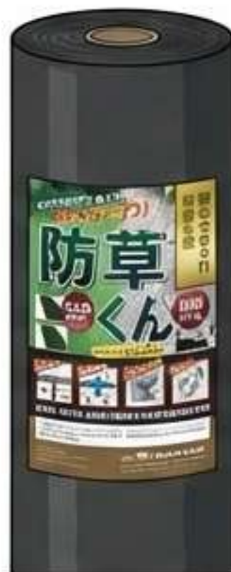
強力：HYPER 防草くん (120g/m 2 ) 駐車場・強雑草向け