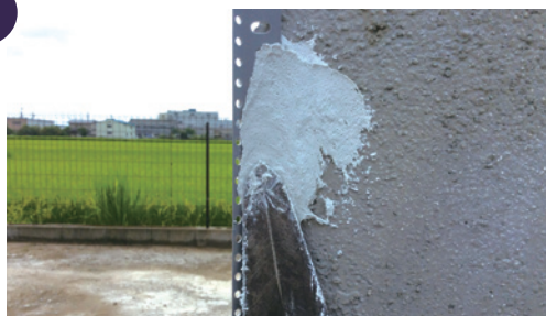
3. はみ出したHSタックを、平滑に伸ばす。