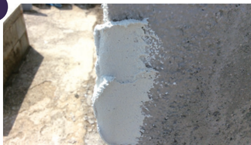
1. コーナー部に20cm～30cm間隔でHSタックを塗り付ける。