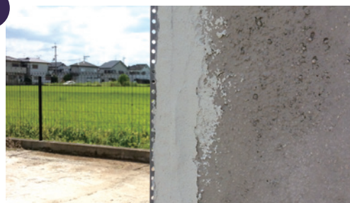
4. 全体にHSタックを塗り付ける。約12時間で硬化します。翌日より施工ができます。