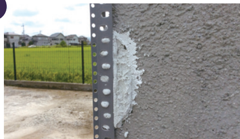
2. 定木を取り付ける。